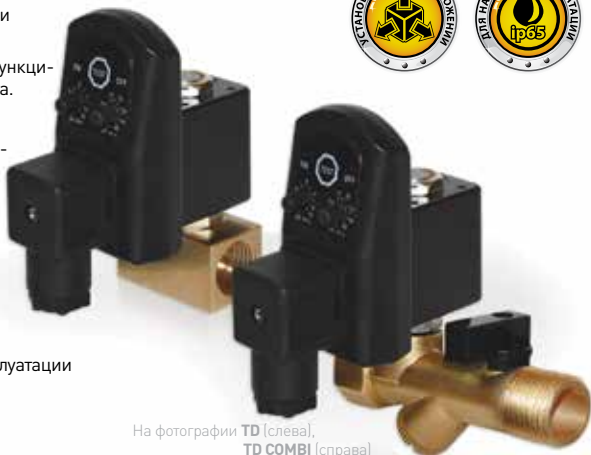
На фотографии TD (слева), TD COMBI (справа)